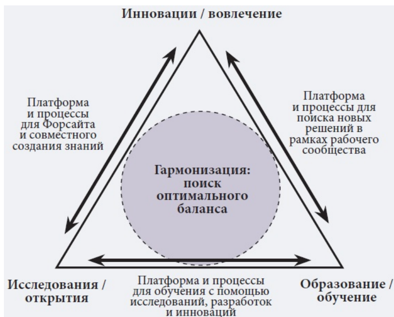
Рис. 1. Треугольник знаний: наука – образование – инновации Fig. 1. The Knowledge Triangle: Research – Education – Innovation

общественностью и бизнесом помогает найти применение новым идеям в создании инновационных продуктов, процессов и услуг.