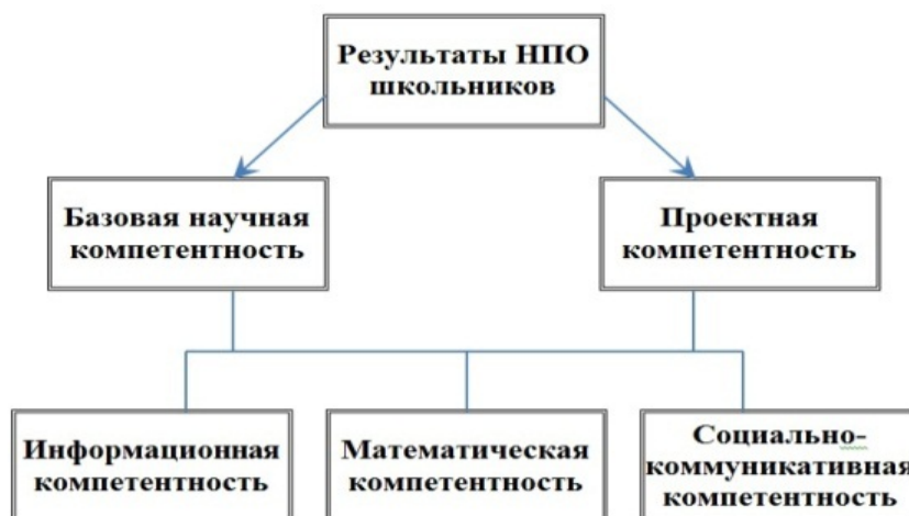
Рис. 3. Компетентностно-ориентированные результаты научно-практического обучения школьников

Понятие проектной компетентности связано со способностью индивида к созиданию, конвертации знаний и идей в конкретные продукты и решения.