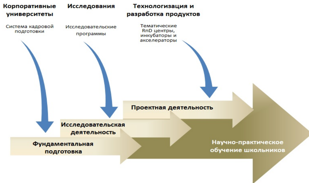
Рис. 2. Изоморфизм методологии технологического парка и структуры научно-практического обучения школьников