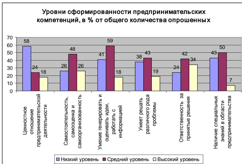
Рис. 3. Уровни сформированности предпринимательских компетенций

тельских компетенций студентов Национального исследовательского Томского политехнического университета отражен на рисунке 3.