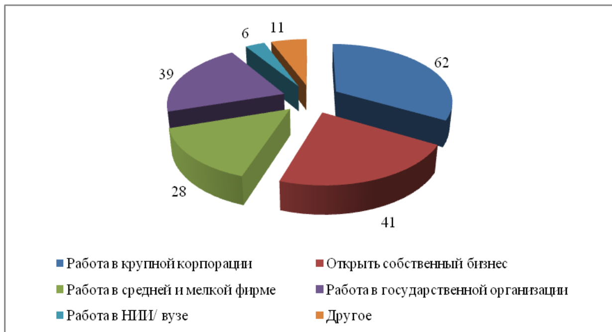
Рис. 2. Профессиональные предпочтения выпускников

На рисунке 2 отражены профессиональные предпочтения выпускников.