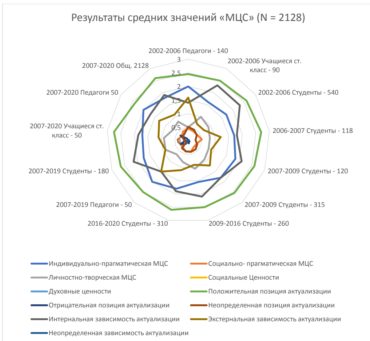
Рис. 1. Результаты средних значений по методике «МЦС» (N = 2128)