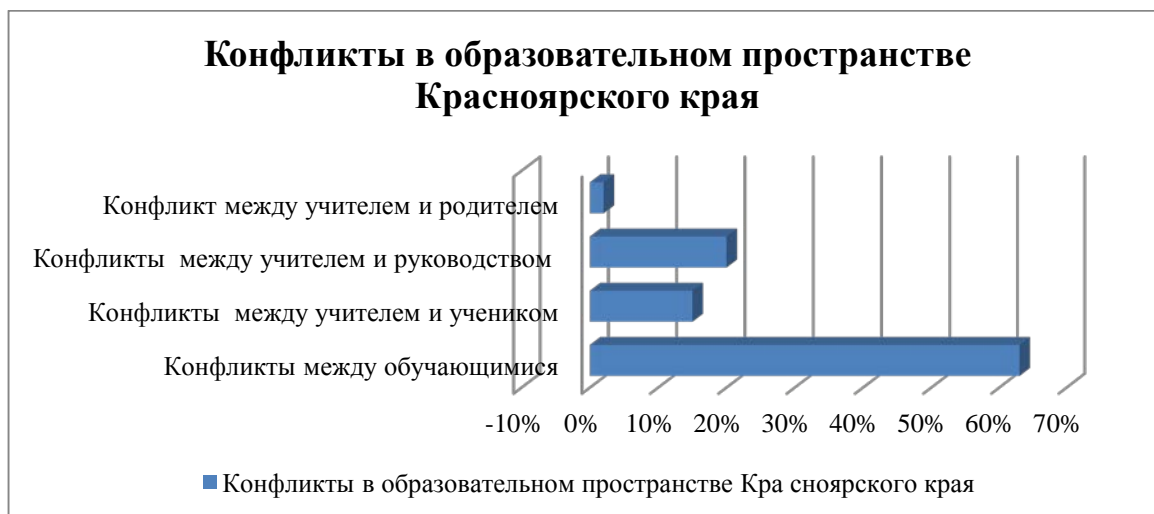
Рис. 1. Процентное соотношение участников образовательных отношений и возникающих конфликтов в образовательном пространстве Красноярского края

Исследование, развернутое на территории Красноярского края, привело к заключению, что большинство участников образовательных отношений были участниками конфликтов. Причем самый распространенный конфликт, отмеченный 63 % респондентами – это конфликт между обучающимися (рис. 1).